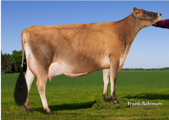
JX PROGENESIS CINDERELLA {6} DAM